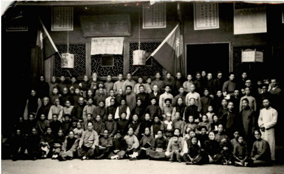
图二：1936年10月在秀山召开的川黔教区年度会议合影