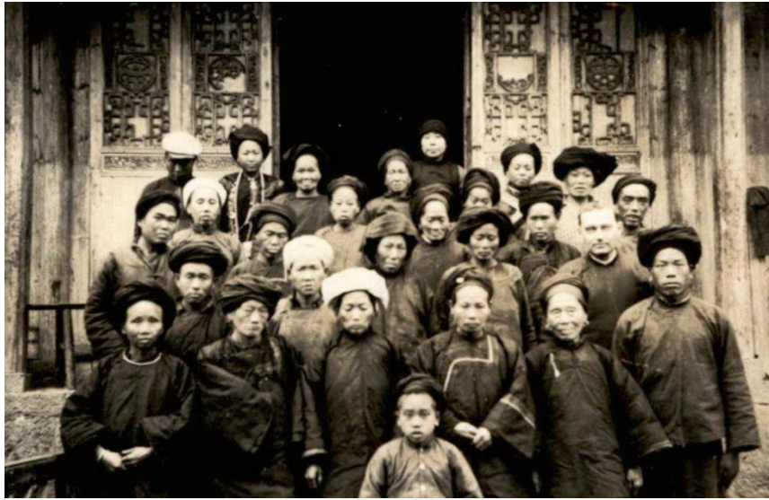
图六：白光照牧师与松桃苗族基督徒