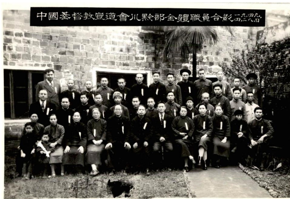
图四：中国基督教宣道会川黔部全体职员合影（1949年4月28日）

员担负要职，反映出多年来西差会以培训教徒，推动自立教会为目标，为宣道会在川黔地区的本土化所作出的努力，亦已见成效。