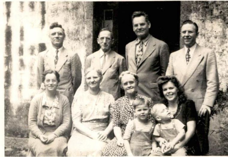
图五：四川龙潭传教士会议合影（1947年5月21-24日）